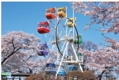
映画などのロケにも使われているレトロな雰囲気の手山公園。50円で乗れる観覧車などが人気。