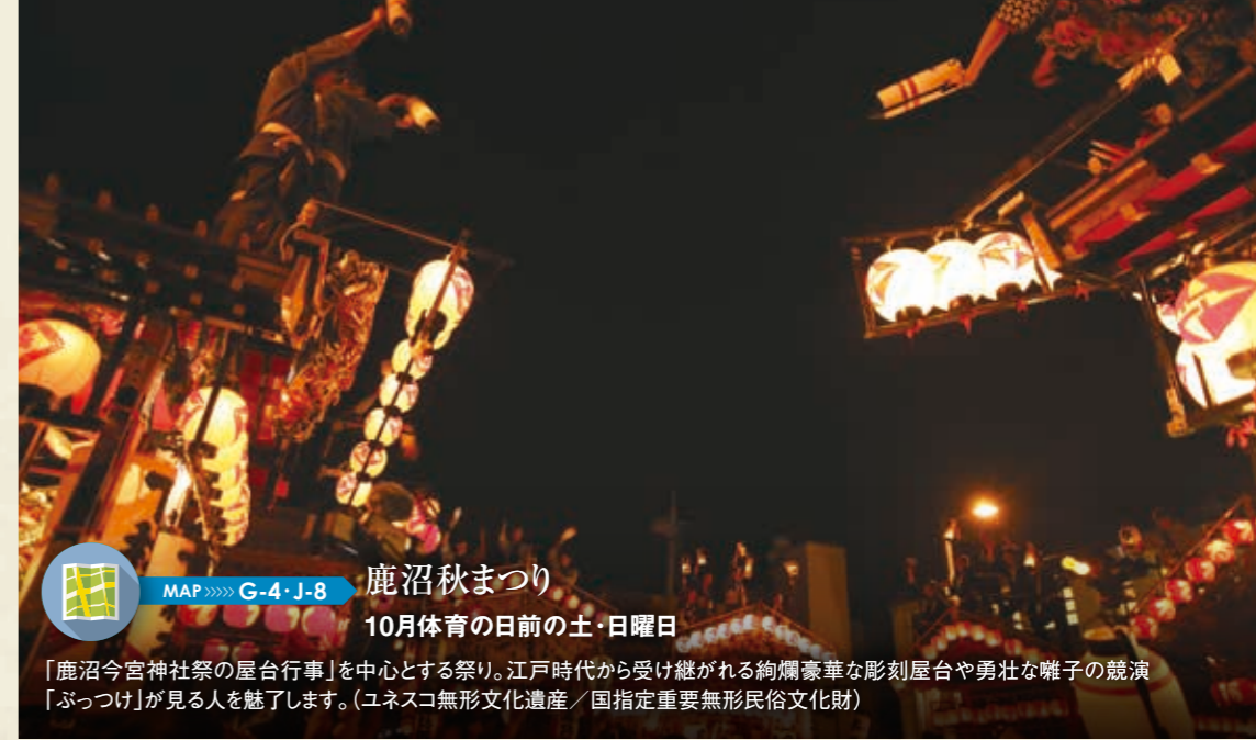
MAP >>>> G-4・J-8 鹿沼秋まつり 10月体育の日前の土・日曜日

横山町の生子神社で、子どもの健やかな成長を祈願して行われます。(国選択無形民俗文化財)