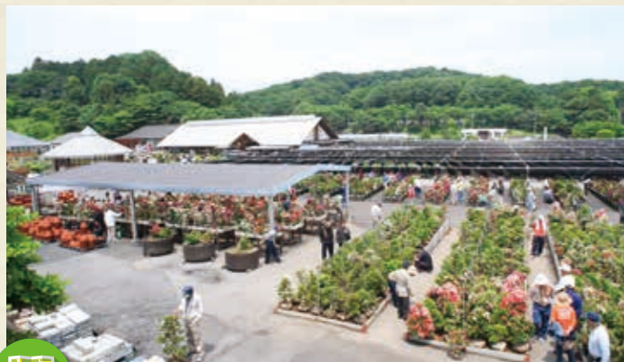
MAP >>> G-5 鹿沼市花木センター

標高差1400m余り。変化に富んだ鹿沼の地形がくれる一番の恵みは、四季折々の多彩な美。一日としてとどまらず、変わりゆくその姿は、いつも私たちを楽しませてくれます。癒しの空間をお楽しみください。