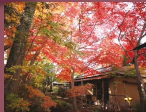
掬翠園 きくすいえん 明治末期から大正初期にかけて造営された日本庭園。当時「鹿沼三名園」と呼ばれたもののうち、現存する最後の庭園です。