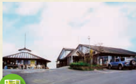
MAP >>> C-3 前日光ハイランドロッジ

山ひとつまるごと利用した市街地の公園です。桜やつつじの名所でもあり、観覧車などの乗り物も楽しめます。