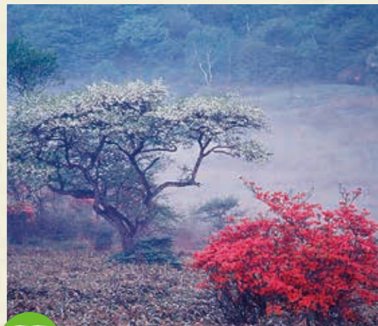
MAP >>> C-2 古峰ヶ原高原

初心者でも安心して楽しめるキャンプ場。近くにはカジカガエルの声が響く清流が流れ、高鳥屋山ではハイキングが楽しめます。