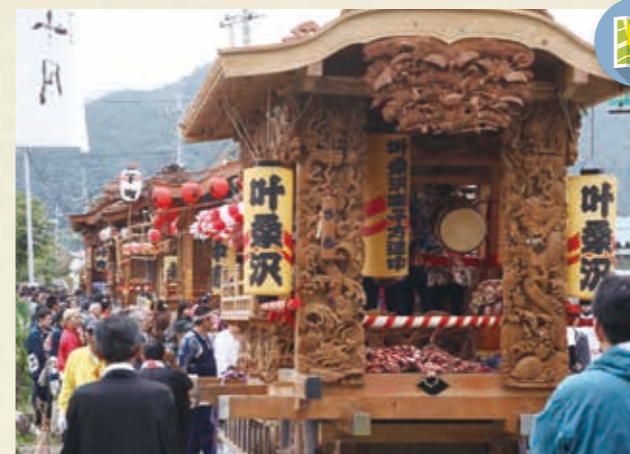
MAP >>>> N-11 口栗野神社秋季例大祭

「鹿沼今宮神社祭の屋台行事」を中心とする祭り。江戸時代から受け継がれる絢爛豪華な彫刻屋台や勇壮な囃子の競演「ぶっつけ」が見る人を魅了します。(ユネスコ無形文化遺産/国指定重要無形民俗文化財)