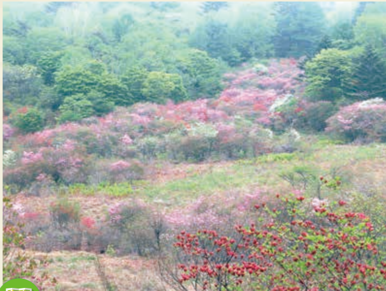
MAP >>> C-3 横根山・井戸湿原

横根高原ハイキングコースにある井戸湿原は「小尾瀬」とも呼ばれ、つつじなどのほか様々な植物を楽しむことができます。