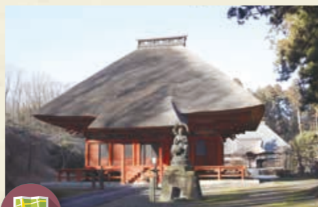
MAP >>> G-6 東高野山 医王寺 日光を開山した勝道上人によって765年に創建され、弘法大師空海によって東高野山の山号が与えられたといわれているお寺です。広大な境内には、建物も含めて30件の県指定文化財と3件の市指定文化財があります。5月3日の花まつりには稚児行列が行われます。