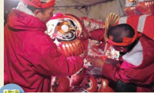
MAP >>>> K-9 花市 1月第4土曜日

激しく燃え上がった護摩の炎がおさまると、読経が響く中、修験者や参拝者が素足でその上を歩き、厄除けを祈願します。