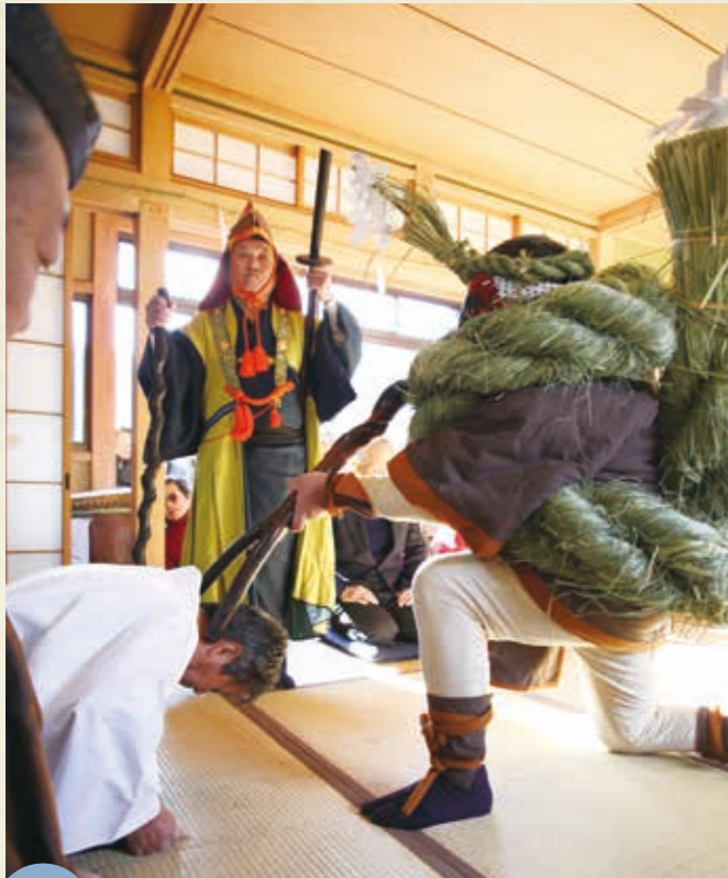
MAP >>>> C-4 ほっこうし 発光路の強飯式 1月3日

地方の日常は、都市の方にとって新鮮に見えることでしょう。 「ハレの日」ともなればそこにはたくさんの刺激が隠れています。 「しきたり」や日々の営みから生まれた数々の行事に息づく、 鹿沼の心をお楽しみください。