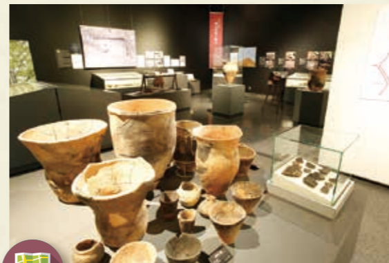
MAP >>> K-8 文化活動交流館 (郷土資料展示室) 郷土資料展示室、創作工房、市民ギャラリーからなる施設です。彫刻屋台や、鹿沼市を代表する「明神前遺跡」の出土品など、歴史資料を展示しています。建物は地元産の深岩石を使用しており、また敷地内には築100年の石蔵も残されています。黒川のせせらぎを眺められる芝生広場は憩いの空間として親しまれています。