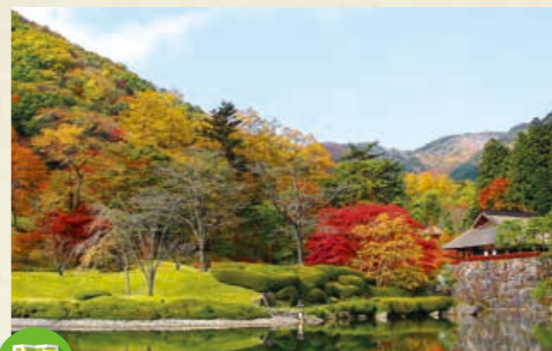
MAP >>> C-2 古峯園

種々の花、野鳥、輝く緑、紅葉、雪景色と一年を通じて楽しめる高原。歩きやすいハイキングコースが人気です。