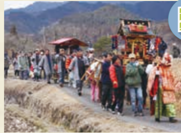
MAP >>>> F-2 板荷のアンバ様 3月第1土・日曜日

アンバ様の神輿が板荷地区の家々を回り、家内安全を祈願。同行する大天狗・小天狗は悪魔を払います。