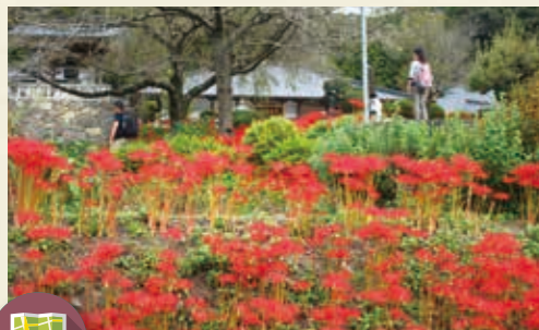
MAP >>> E-5 常楽寺 秋に彼岸花の名所として知られる常楽寺。運が良ければ彼岸花とそばの花を同時に見ることができます。境内に名医録事法眼(中野智元)を記していることから、このお堂が「録事尊」と呼ばれ、毎年2月には大祭が行われます。