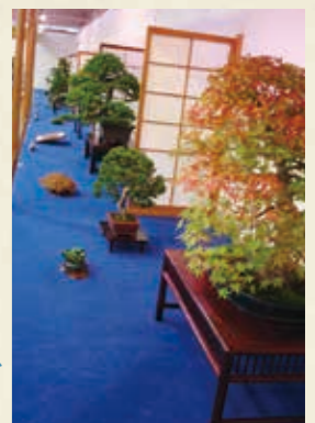
MAP >>>> G-5 鹿沼園芸フェア 10月下旬から

延長年間に創立された神社で、明治5年に口栗野神社と改称しました。氏子町11町のうち7町が屋台を持っていて隔年で巡行するほか、神前で奉納囃子を行います。