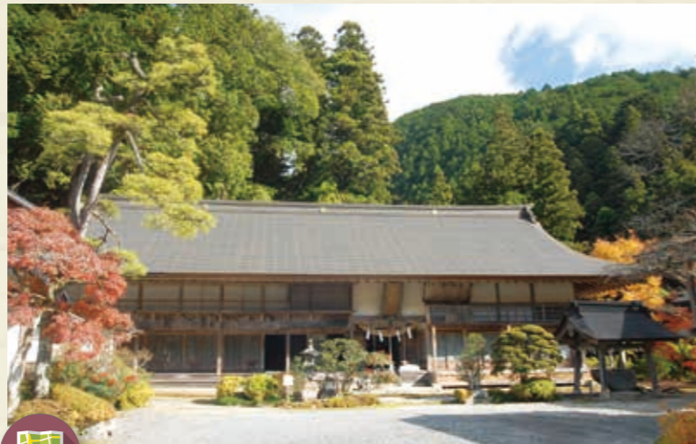
MAP >>> D-4 賀蘇山神社 創建は878年以前に遡ると言われます。境内には宿坊、遙拝殿、大杉切株などがあり、例大祭には関白流獅子舞が奉納されます。