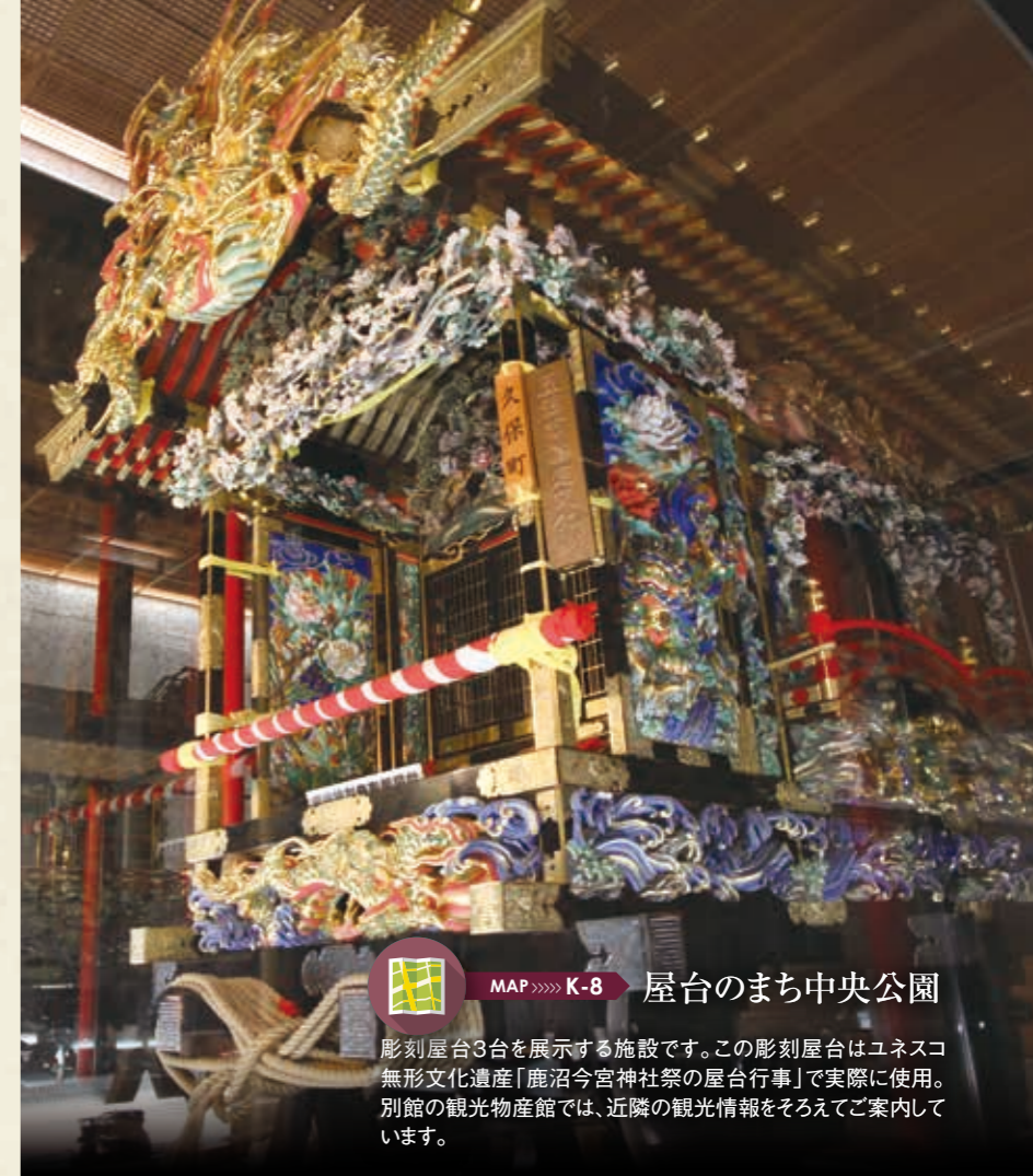
MAP >>> K-8 屋台のまち中央公園 彫刻屋台3台を展示する施設です。この彫刻屋台はユネスコ無形文化遺産「鹿沼今宮神社祭の屋台行事」で実際に使用。別館の観光物産館では、近隣の観光情報をそろえてご案内しています。