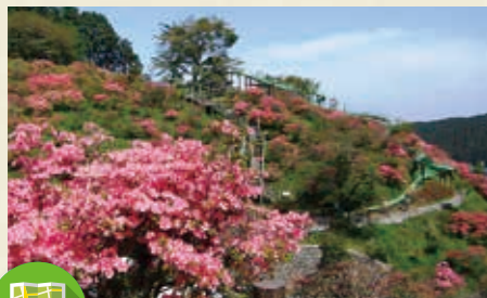
MAP >>> E-5・N-12 城山公園

東京からでも日帰りできる本格登山コース。様々な花を楽しめるほか、日光連山を一望でき、また標高の割に険しいことで人気です。関東平野が日光連山に出会う場所である鹿沼には、このような登山対象の山が33座あります。