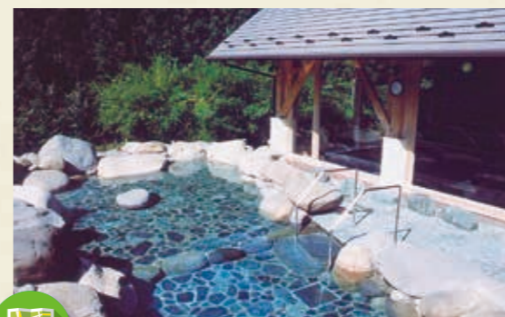
MAP >>> C-3 前日光つつじの湯交流館

大芦川源流の清い水と自然の地形を活かした回遊式の日本庭園です。周囲の山々による演出効果もあいまって、四季を通じて楽しめる豊かな庭園です。