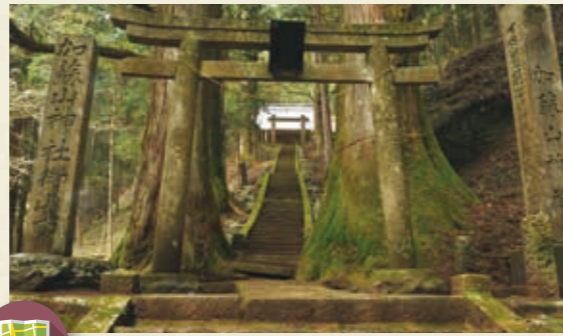
MAP >>> D-3 加蘇山神社 878年以前の創建と伝えられる神社です。杉や千本かつらなどの天然記念物もあり、山岳信仰の名残を感じることができます。

古くから日光とともに歩み、文化を共有する鹿沼。 日光開山の昔からさまざまな物語が繰り返り広げられ、 いたる所にその証が残されています。 歴史の遺産が演出する、時を超えた空間をお楽しみください。