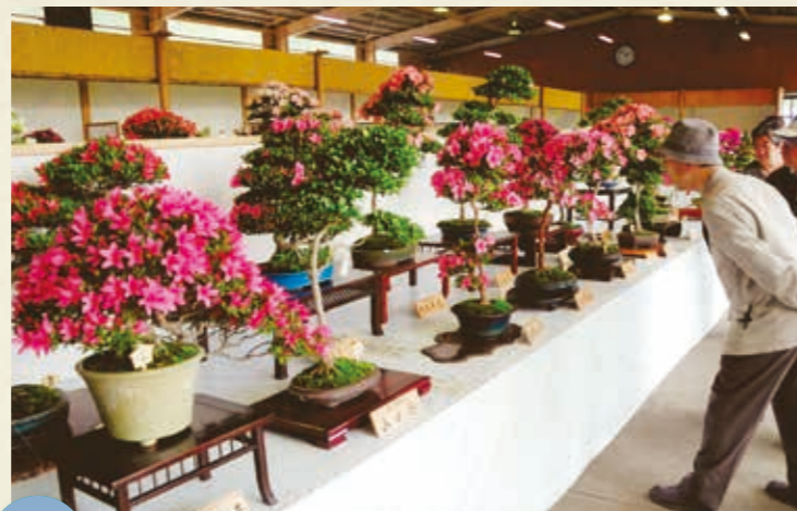
MAP >>>> G-5 鹿沼さつき祭り 5月最終土曜日から10日間

アンバ様の神輿が板荷地区の家々を回り、家内安全を祈願。同行する大天狗・小天狗は悪魔を払います。