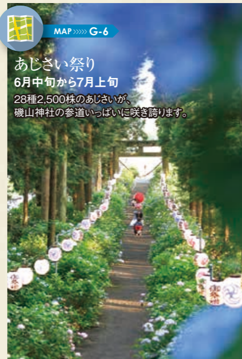
MAP >>>> G-6 あじさい祭り 6月中旬から7月上旬

全国一のさつきの祭典。約1千種類、1万本以上のさつきの花を楽しめるほか、ガーデニング全般の情報を用意しています。