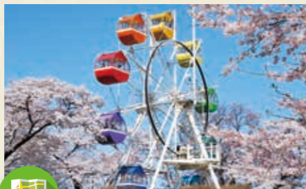
MAP >>> G-4・J-7 千手山公園

城跡の山一面に2万株のつつじが咲く大規模公園です。梅・桜・しゃくなげも見られるほか、大きなローラー滑り台も楽しめます。