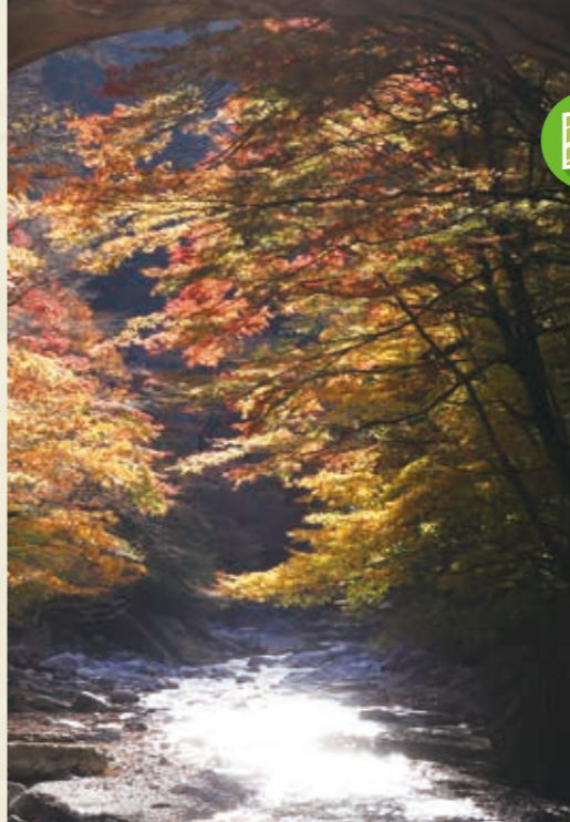
MAP >>> D-1 大芦渓谷

横根高原ハイキングコースにある井戸湿原は「小尾瀬」とも呼ばれ、つつじなどのほか様々な植物を楽しむことができます。