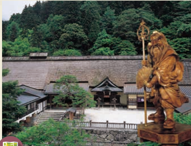
MAP >>> C-2 古峯神社 日本武尊を祀る神社。江戸時代には「天狗使い」として有名で、嵐除け・火防などの災難除けに霊験あらたか。