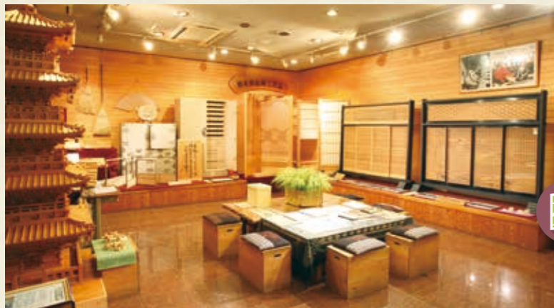
MAP >>> K-8 川上澄生美術館 木版画家であり詩人でもあった川上澄生の作品を収蔵・展示しています。毎年5月には、代表作「初夏の風」の特別展示を行います。この作品は、棟方志功が版画の道を志すきっかけとなった作品としても有名です。