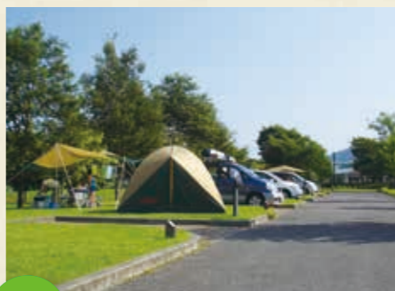
MAP >>> F-5 出会いの森総合公園 オートキャンプ場

初心者でも安心して楽しめるキャンプ場。近くにはカジカガエルの声が響く清流が流れ、高鳥屋山ではハイキングが楽しめます。