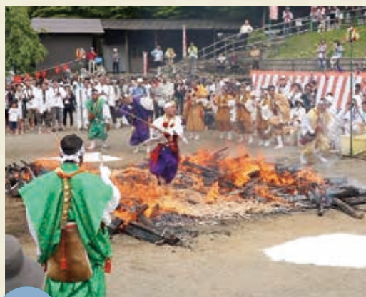
MAP >>>> D-2 金剛山火渡り修行 5月最終日曜日

妙見神社の当番引継ぎの際に行われる行事。山伏と強力が新旧の当番や来賓、氏子に厳しく、時にユーモラスな口上を述べ、高盛飯を強いた後、責め棒で首根を押さえて祝います。(国指定重要無形民俗文化財)