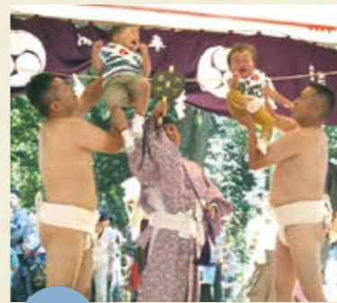
MAP >>>> G-5 泣き相撲