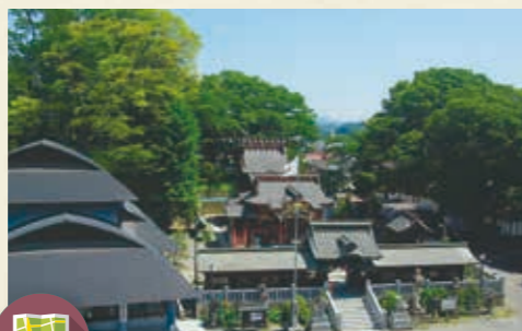
MAP >>> J-8 今宮神社 1534年に壬生綱房が鹿沼城の鎮守として創建しました。壬生氏滅亡後は1608年に鹿沼宿の氏神として再建されました。毎年10月には豪華絢爛な彫刻屋台が繰り出す秋まつりが行われます。