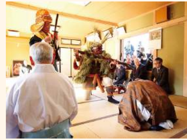
ほっごろうじ 発光路の強飯式 / 1月3日 山伏と強力に扮した村人がユニークな口上で来客に高盛飯を強いる国指定重要無形民俗文化財。