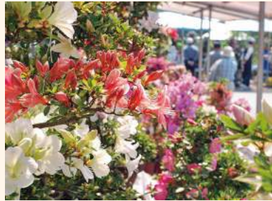
鹿沼さつき祭り / 5月下旬 全国最大級のさつきのお祭りで、愛好者が集う。約300点の見事なさつきの展示は必見。