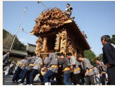
鹿沼秋まつり / 10月 絢爛豪華な彫刻屋台を曳き回す、ユネスコ無形文化遺産にも登録された祭。