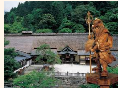
ふるみね 古峯神社 「日光修験」のパワースポット。別名「天狗の社」とも呼ばれ、天狗の御朱印も人気。