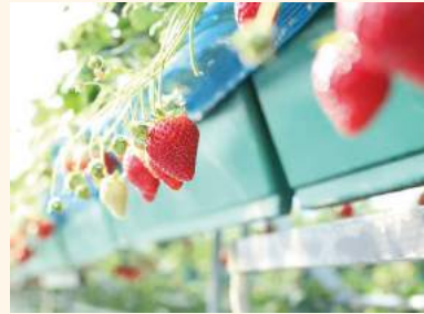
いちご狩り / 1~5月中旬 品質日本一といわれる鹿沼のいちご。もぎたての完熟いちごを体験してみては。