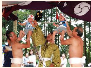
いきご 生子神社の泣き相撲 / 9月 無病息災を祈願して赤ちゃんの泣き声を競う、全国でも珍しい奇習。