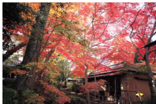
【掬翠園】 きくすいえん

鹿沼の誇る歴史遺産「彫刻屋台」。この施設には江戸時代に作られた3台を収蔵しています。3台はそれぞれ、歴史背景によって特徴ある姿をしています。ぜひ見比べてみて。